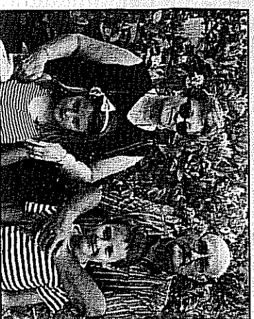
Diferentes indígenas de Antonio Pinzón en diferentes etapas