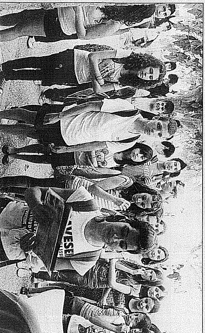
Este centro educativo recibió a los participantes en este concurso