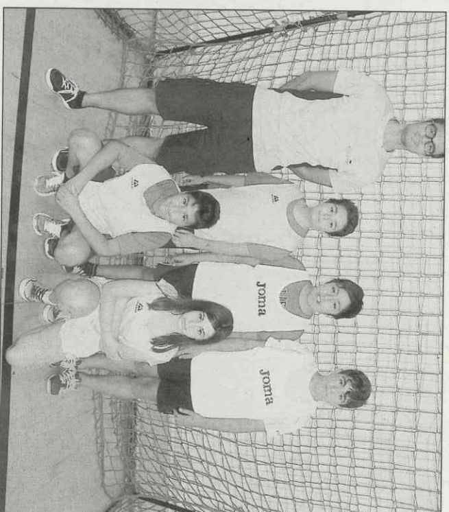
Los colegios "Comarcas" y "La Cruz". Debajo, "La Milagrosa" y "Reina Sofía"