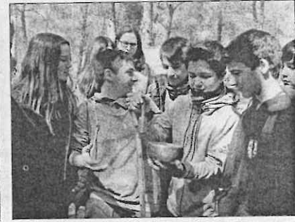
Los participantes en esta actividad