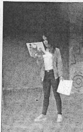
A la izquierda, Lectura dramatizada e ilustrada sobre El Quijote . A la derecha, Performance en el patio sobre el teatro de la Generación del 98