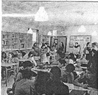
Visión de películas basadas en la obra de Roald Dahl y exposición sobre su obra