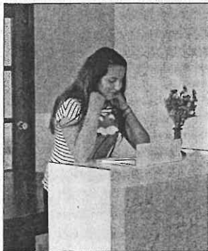
Imágenes recital poético