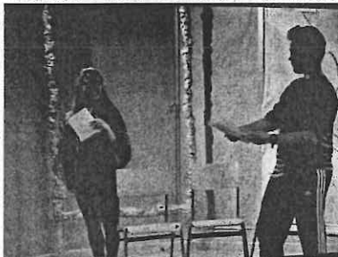
Bajo estas líneas, Escena teatral de La casa de Bernarda Alba