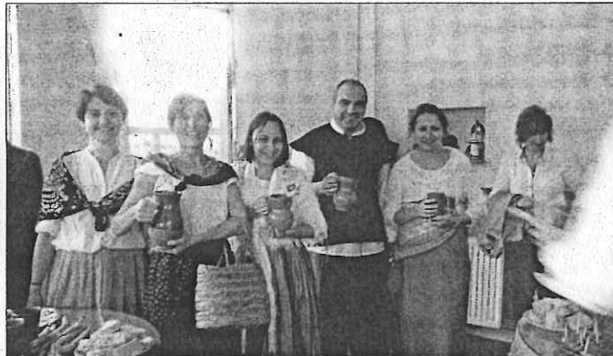
Profesores caracterizados de personajes de El Quijote