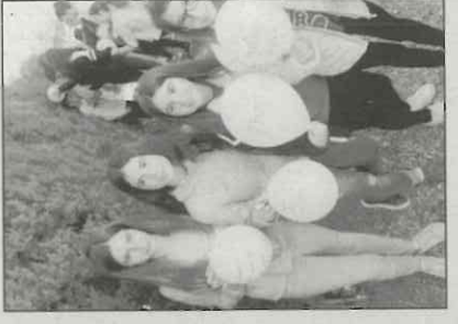
Las imágenes superiores y la de debajo de estas líneas pertenecen a las actividades en el colegio "Reina Sofía"; mientras que las situadas a la derecha son de las actividades llevadas a cabo en el IES "Prado Mayor".