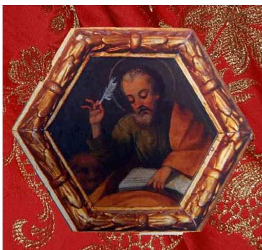
Imagen 7: San Marcos en una de las pechinas de la cúpula del camarín del Santuario de Santa Eulalia.

Detalle de algunas de las representaciones de San Marcos Evangelista en Totana: