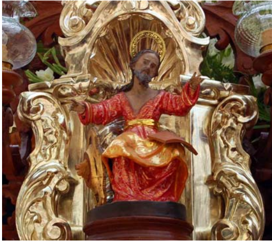
Imagen 9: San Marcos en el trono de la Hermandad de San Juan Evangelista.