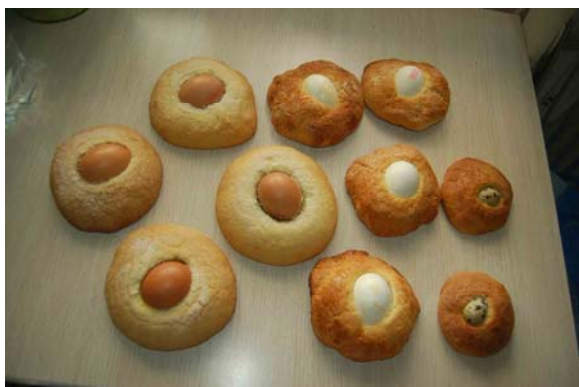
Imagen 6: Los Garabazos tradicionales se elaboran con masa de torta de naranja y/o masa de torta de Pascua. Para los más pequeños, se elaboran garabazos de menor tamaño y con huevo de codorniz.